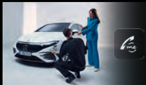
Unfallmanagement und Pannenmanagement